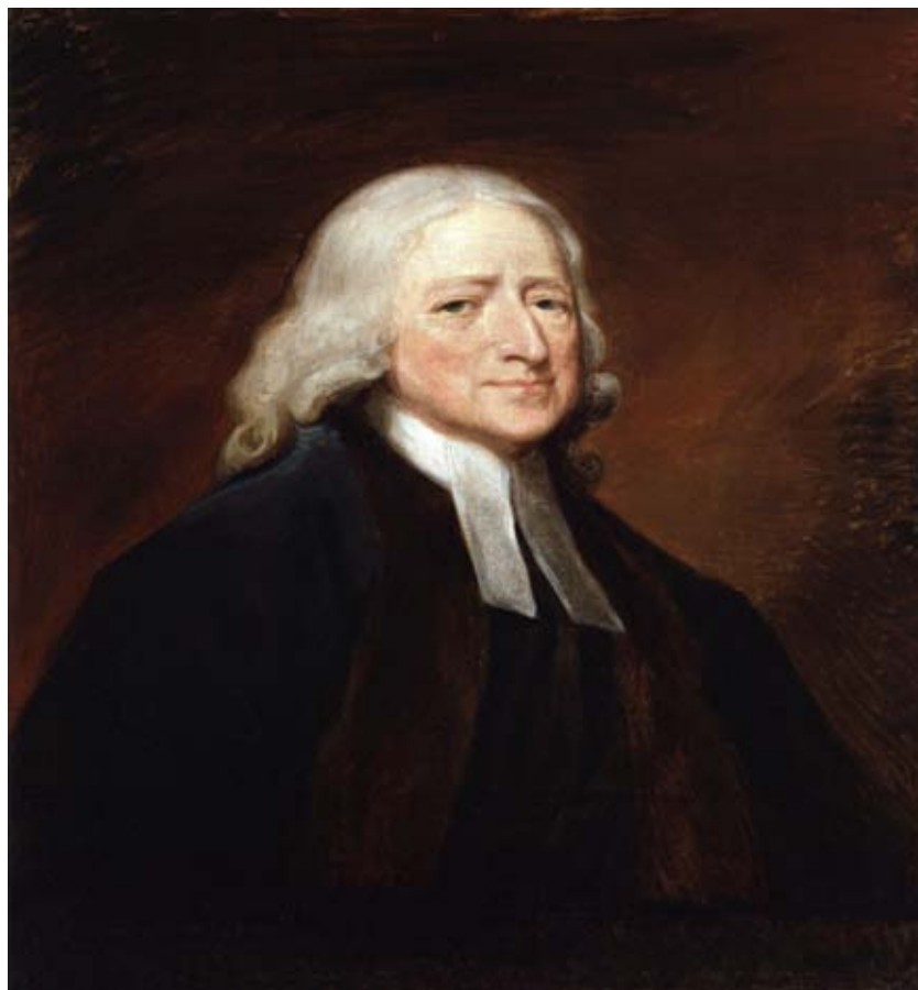
John Wesley (1703 – 1791)

- Owocem spotkania będzie recenzowana, punktowana monografia pokon-ferencyjna wydana w 2017 roku w Naukowej Serii Wydawniczej „Colloquia Orientalia Bialostocensia”.