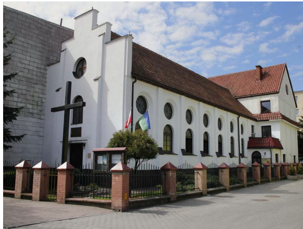
Kościół Miłości Bożej w Ełku: stan współczesny